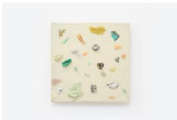
PP -drowsy poison-

© Taichi Moriyama, courtesy KANA KAWANISHI GALLERY photo by Shinichiro Ishihara