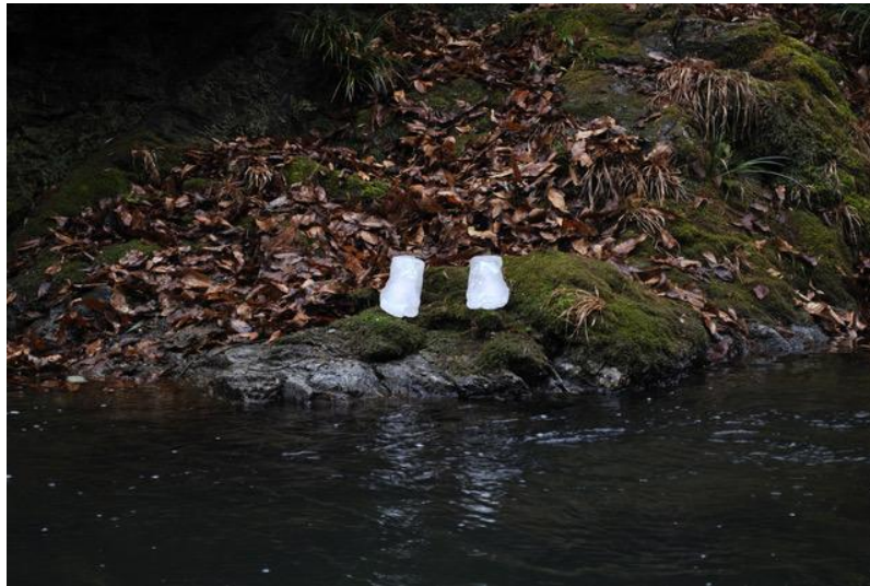
Into the River

2010 | © Taichi Moriyama, courtesy KANA KAWANISHI GALLERY