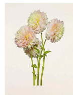
left: 08_Dahlia / Sheer Heaven - Bloom | 2020 right: 08_Dahlia / Sheer Heaven - Afterglow | 2023