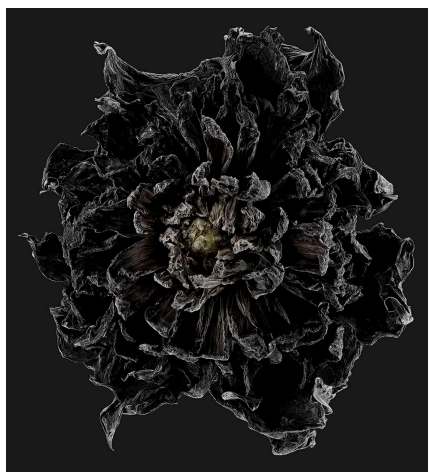
07_Dahlia / Spartacus - Afterglow