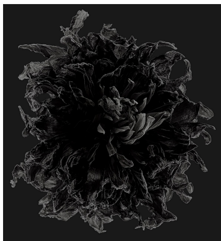
10_Dahlia / Caballero - Afterglow