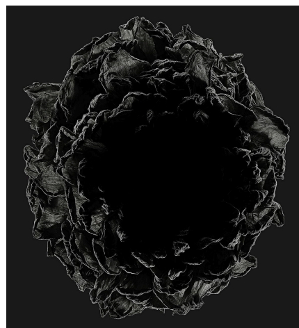
12_Dahlia / Eveline - Afterglow

2023 | archival pigment print | 1300 x 1100 mm © Kenji Toma, courtesy KANA KAWANISHI GALLERY