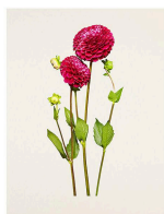
left: 18_Dahlia / Ivanetti - Bloom | 2020 right: 18_Dahlia / Ivanetti - Afterglow | 2023

2023 | archival pigment print | 1300 x 1100 mm