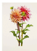
left: 13_Dahlia / Ben Huston - Bloom | 2020 right: 13_Dahlia / Ben Huston - Afterglow | 2023