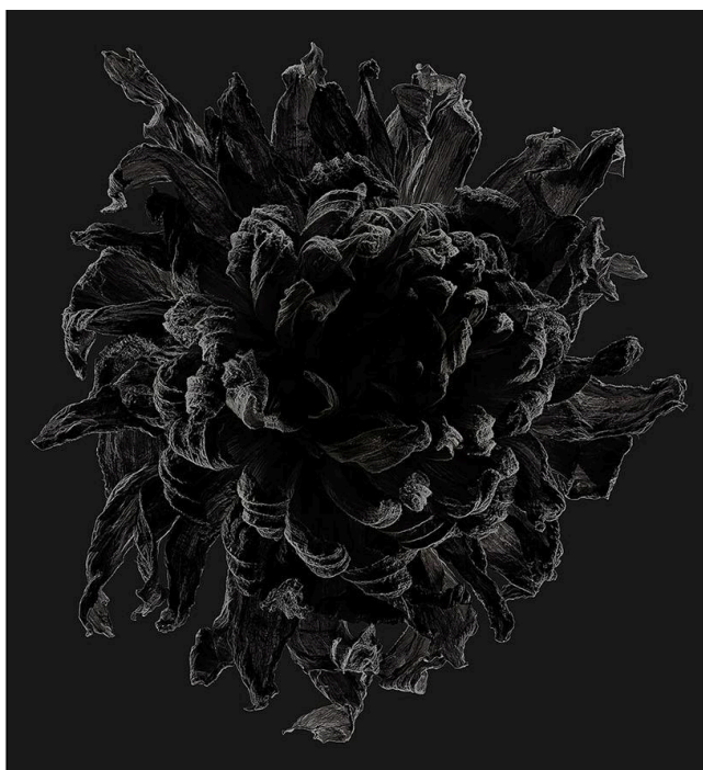
left: 15_Dahlia / Calient - Bloom | 2020 | archival pigment print | 750 × 610 mm right: 15_Dahlia / Calient - Afterglow | 2023 | archival pigment print | 750 × 610 mm

KANA KAWANISHI PHOTOGRAPHYは、2026年4月18日（土）より藤間謙二個展『花を通して考える / 11の個性（11 Individuals）』を開催いたします。