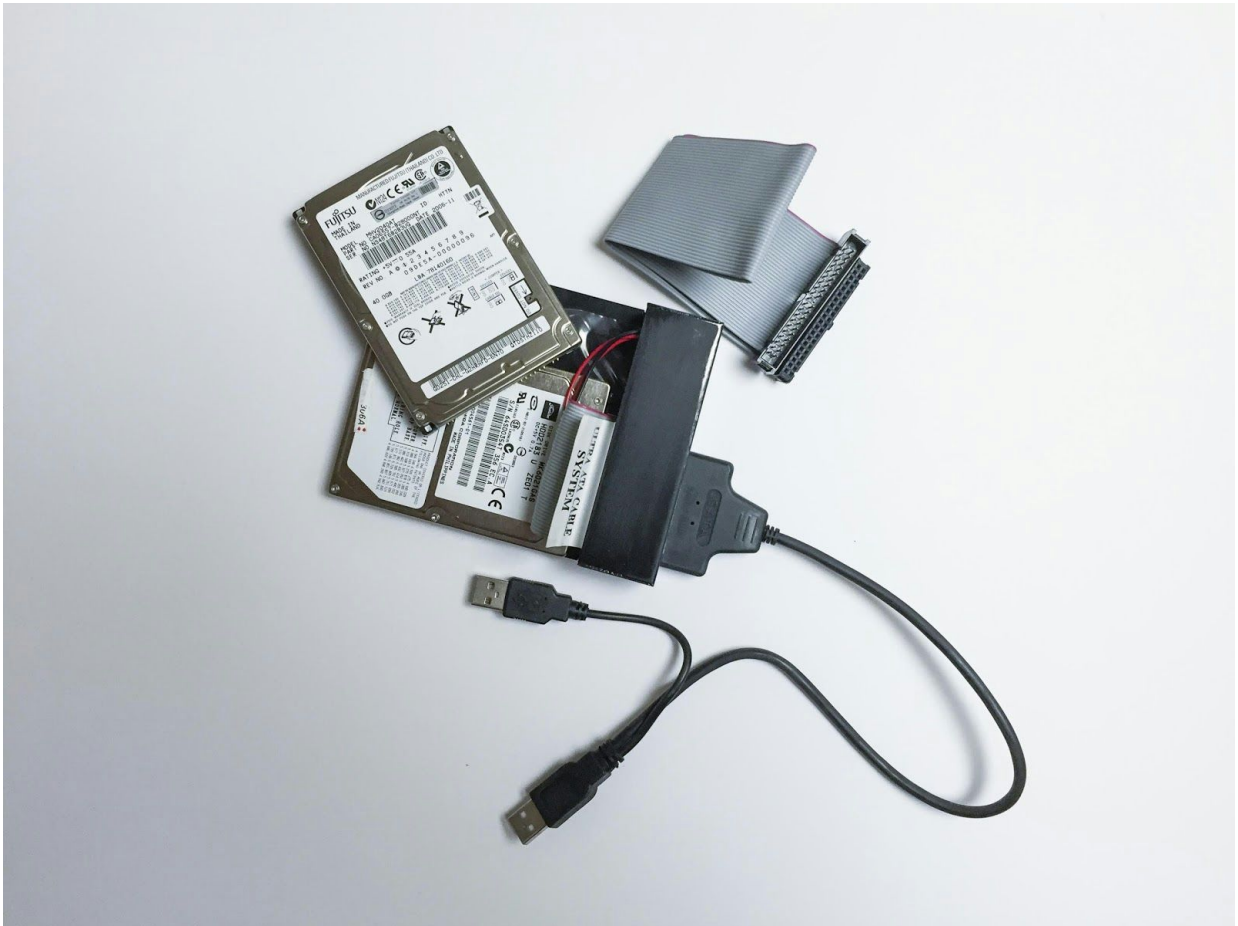
Invisible Existence (production footage image) 2016, mixed media © Hideo Anze, courtesy KANA KAWANISHI GALLERY

また本展覧会のタイトルにも冠されている新作《姿なき存在》は、安瀬が写真表現を行う際に注目してきた時間性・記録性をテーマにし、中古販売されていたデータ記録が消去済みの旧式HDD（ハードディスクドライブ）を用いた初の彫刻作品になります。