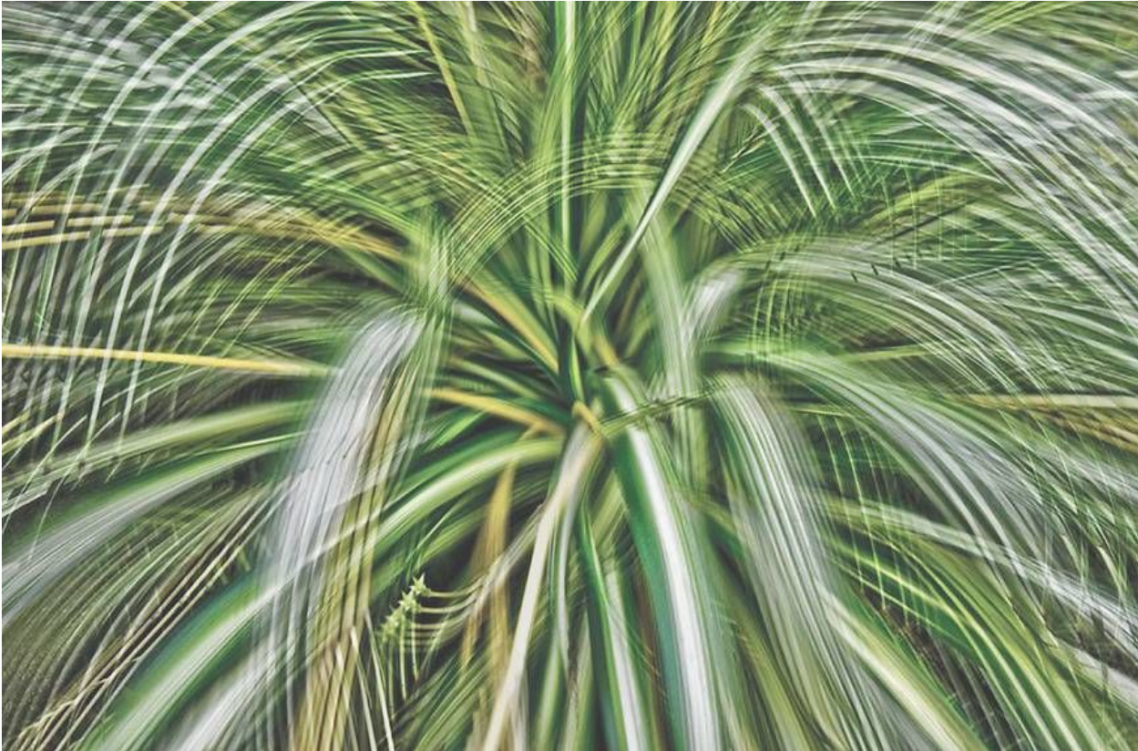
'Artificial view_botanical_7' | © ATSUSHI OKABE, COURTESY KANA KAWANISHI GALLERY

http://www.japantimes.co.jp/culture/2015/06/30/arts/dont-take-everyday-objects-face-value/