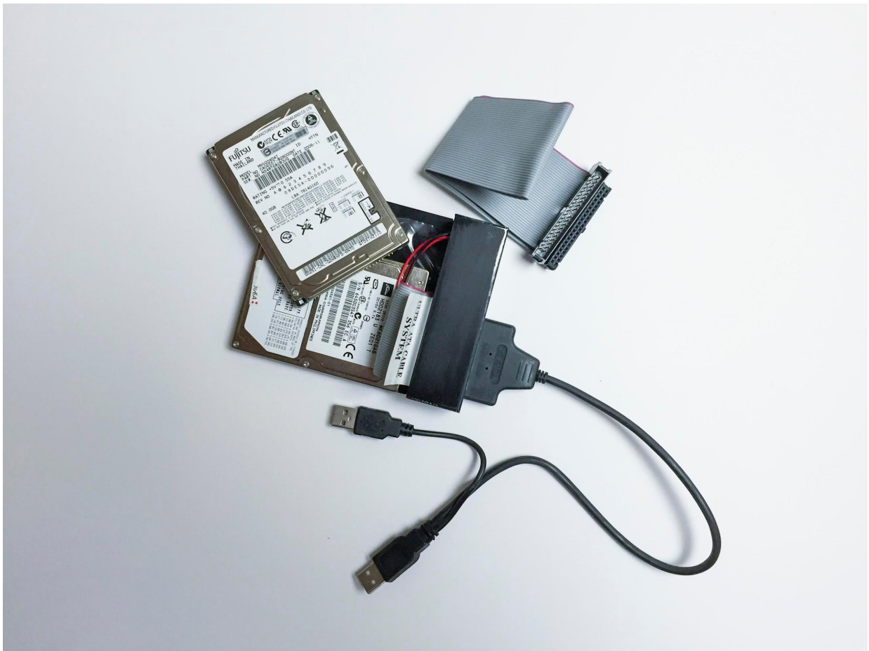
Invisible Existence (production footage image) 2016, mixed media © Hideo Anze

また本展覧会のタイトルにも冠されている新作《姿なき存在》は、安瀬が写真表現を行う際に注目してきた時間性・記録性をテーマにし、中古販売されていたデータ記録が消去済みの旧式HDD(ハードディスクドライブ)を用いた初の彫刻作品になります。